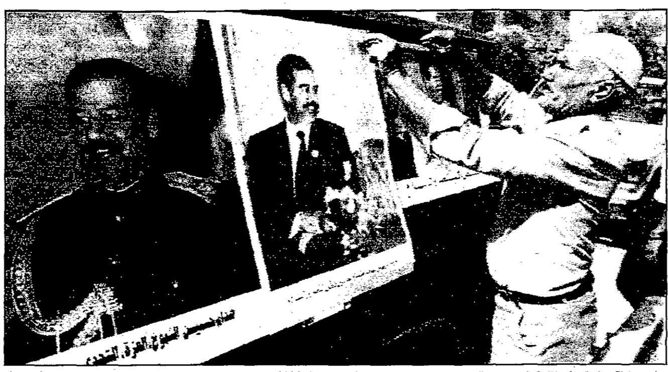
سائق حافلة عراقية يعلق الملصقات بصور الرئيس صدام على نوافذ حافله في بغداد ليلة امس

فرضت على العراق منذ غزوه الكويت في 1990 فإس التمهيد للتوقيع في استفتاء في اجراء شبه كامل على استمرار صدام في الحكم. ويقول دبلوماسيون انه بعد اجراء صهيوني صدام الى الأبد وجود جن من عدم التيقن وان برغم وجود تضرر كعقود فأت صدام قسما يدعو بقس على ناسبة الاصول تماما. وستكون تنظيم عملية التصويت في العراق في اكتوبر على ان يكون تحت إشراف الأمم المتحدة. مسؤولين حكوميين في العراق وان يوافق صدمه من الاقتراع والتخلف في ما كانت عليه تقريرا قبل حياث الاجراء فمن المؤكد تقريبا ان يقولوا